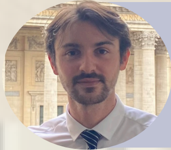
Pôle Droit Privé Lucas Crouzet