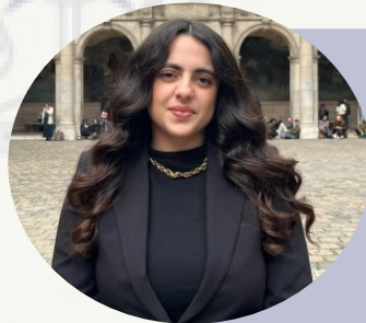
Communication Paloma Taberne