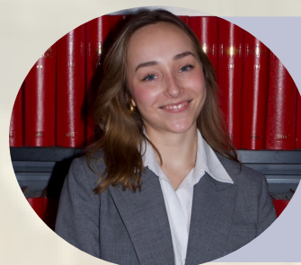
Événementiel Alexandra Bouchaud